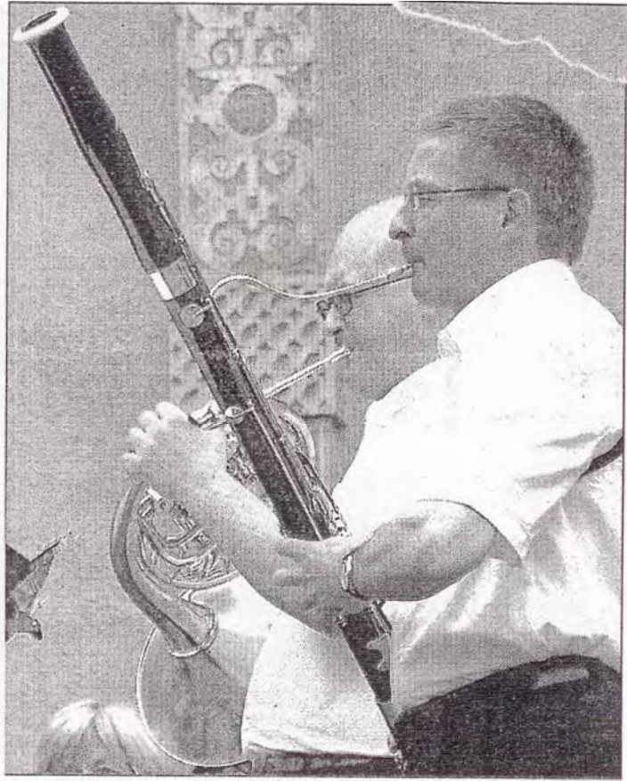
Bevern. Insbesondere die Bläser kommen mit den Open-Air-Bedingungen gut zurecht.